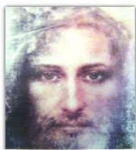
「基督是世界的光」 若八12