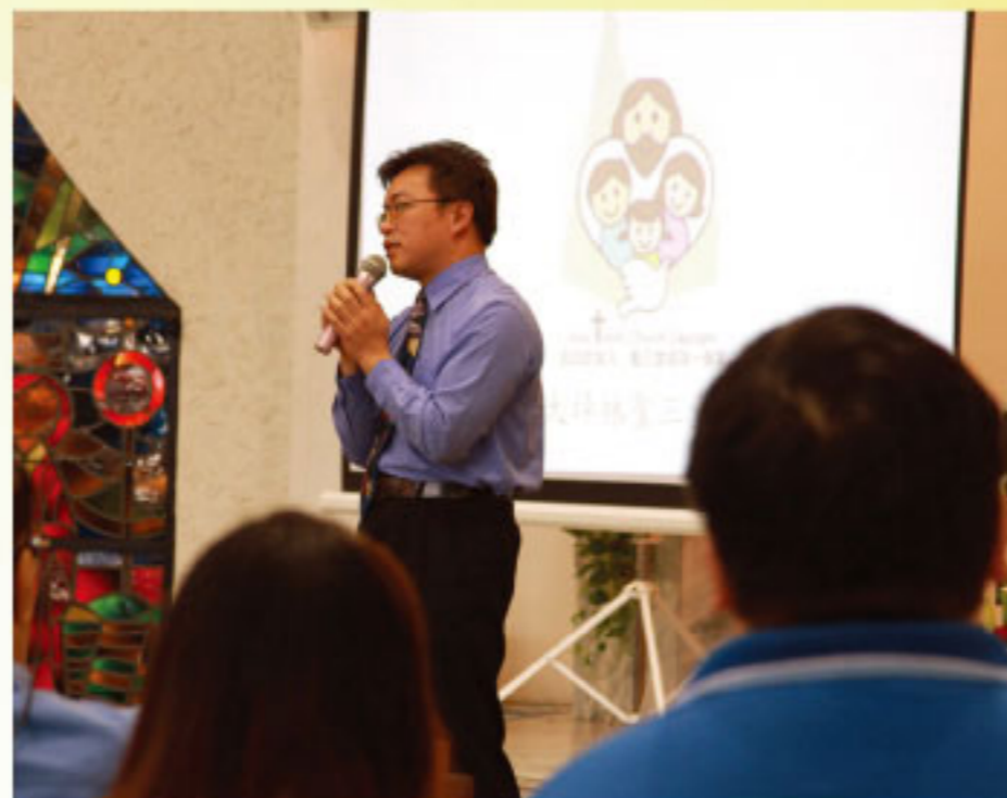
透過信仰的見證，聽聽耶穌要對你說的悄悄話