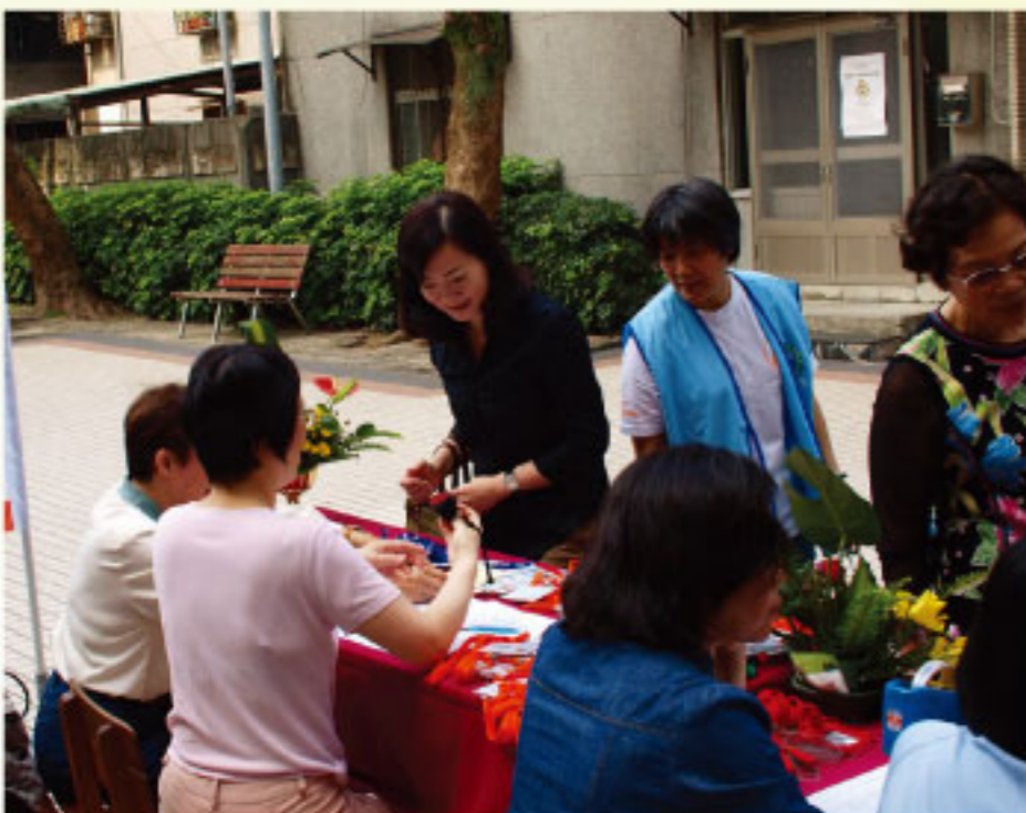
來聽聽耶穌的故事