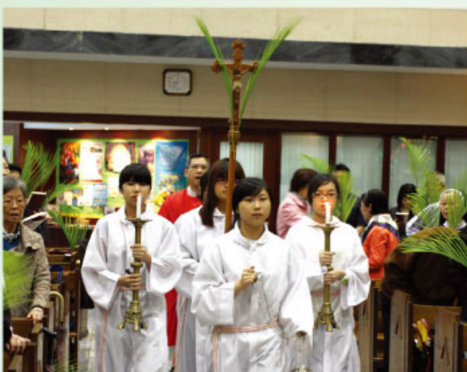
聖枝主日 · 重演耶穌榮進耶京