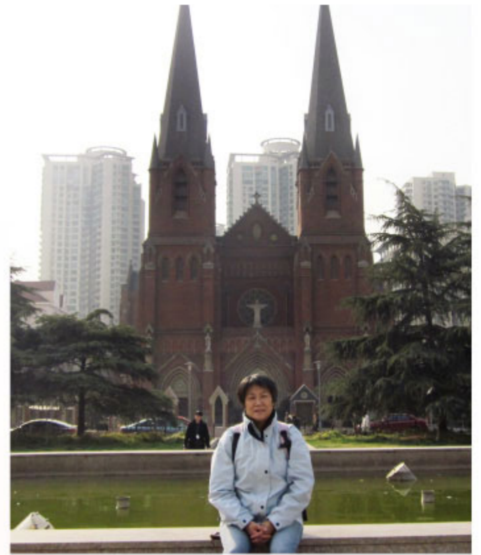
■ 上海徐家匯天主堂

在夕陽下逗留在堂前的噴水池側仰望天主堂，心中有一種莫名的感動，即使是在早年中共極權的統治下，仍有千千萬萬的中國人不畏宗教迫害，堅持信仰上主，恭敬參與彌撒，正如耶穌對門徒所說的：「為義而受迫害的人是有福的，因為天國是他們的。」(瑪五：10)