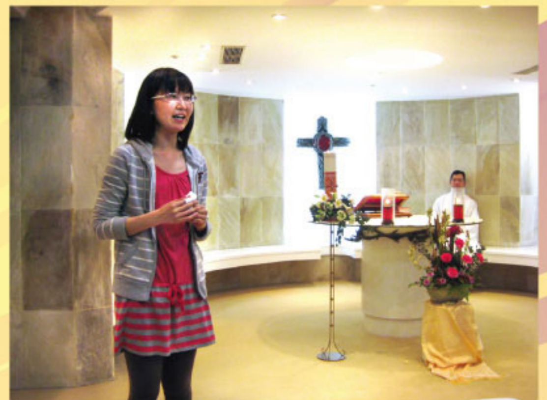
■ 倩倩分享這段時間的心路歷程，體驗到與主一同復活的歡樂，為大家做了最美好的生命見證。

果然，天主展現祂的大能，除了親友悉心照顧，加上主內兄姊們的懇切祈禱及實質幫忙，我的手術前後一切都非常順利，現在我除了行動仍有些許緩慢不便及衣服底下肚皮上酷似YKK拉鍊的傷口之外，看起來實在不像是大病初癒的人，讓我不得不再次相信祈禱的偉大力量及天主的神秘奧蹟！每年的復活節總是要歡欣鼓舞，但今年它卻特別的意義非凡，因為我覺得我也像耶穌基督一樣的復活了，感覺真是很不一樣。