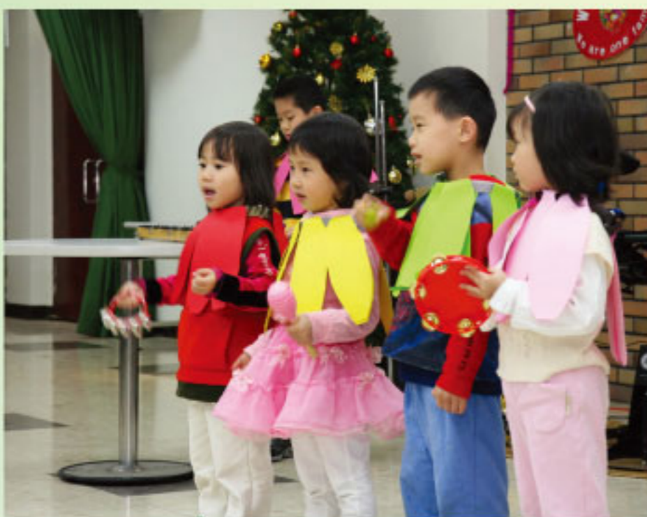
聖誕聯歡會：教會未來的希望