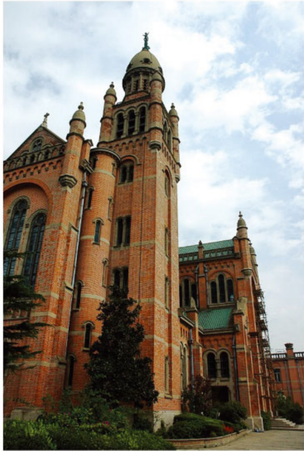
■ 宏偉的佘山聖母大殿

1920年代上海附近周邊教友已達80萬人，原來的大堂陳舊狹小，因此耶穌會決定重建教堂以符需要。1925年奠基，經過十年嚴格督工建造，終於在1935年完工。大堂集多種風格於一體，拱形甬道是羅馬式，廊柱為希臘式，尖頂為哥德式，鐘樓為以色列式，小圓頂為西班牙式，其他清水壁、琉璃瓦、地磚為中國式，最是讓人敬嘆佩服的是整個建築物「四無」，即：沒有釘子、沒有木頭、沒有鋼鐵、沒有橫樑，整個建築平面呈現拉丁式十字形，可同時容納四千人入座。教堂和青山融為一體，輪廓協調自然，教堂頂尖聳立著聖母脚下踩着魔鬼，高舉雙手呈十字狀的小耶穌（編按：此態像又名「吉祥聖母像」），其意義表達歡迎各地前來禮瞻的朝聖者。