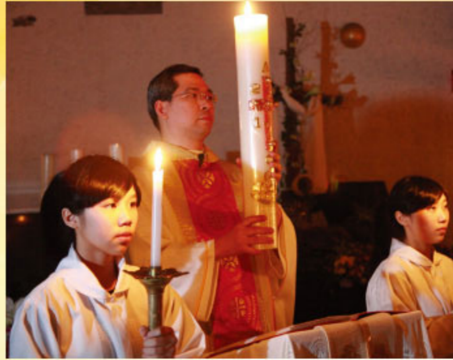
這一夜，主戰勝死亡