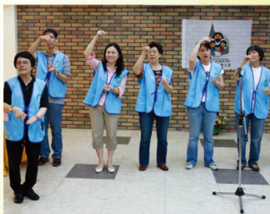
營造歡愉氣氛，用餐、小憩，繼續前行