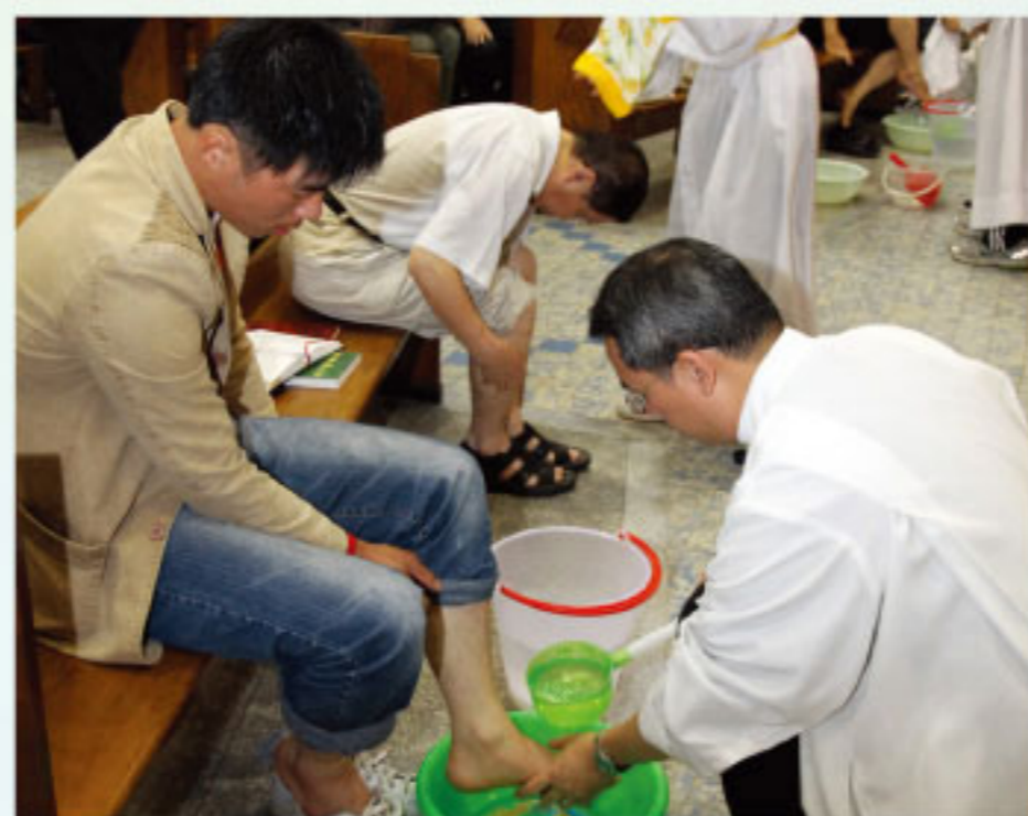
彼此相愛：聖週四濯足禮