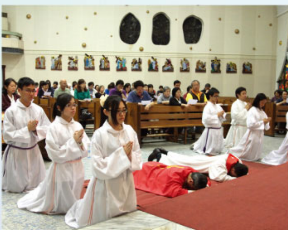
吾主 · 我認錯：聖週五