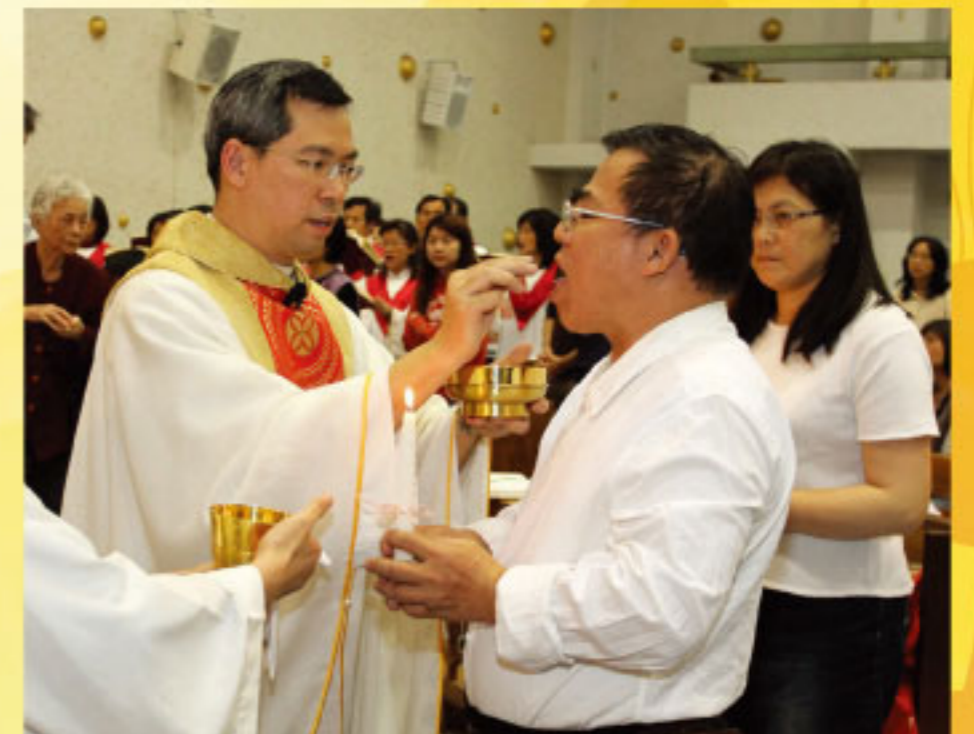
初領聖體，永生之糧