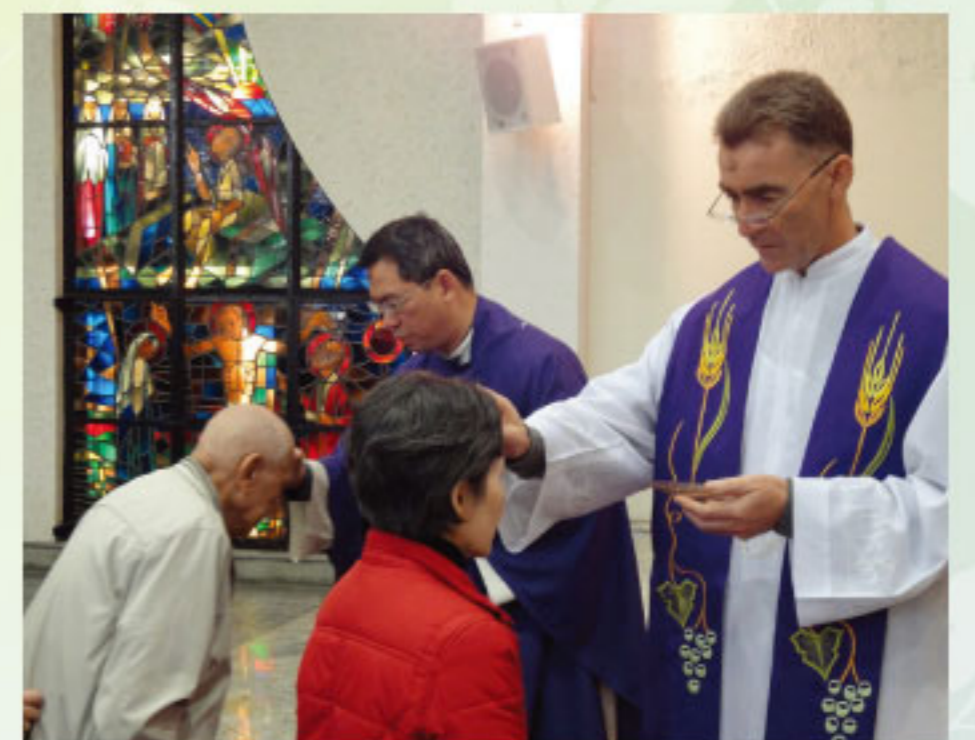
聖灰主日→進入四旬期