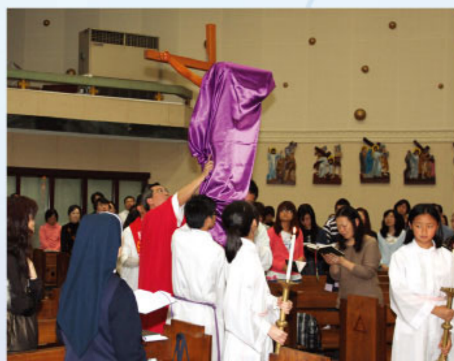
請看十字聖架 · 耶穌藉著它拯救世界