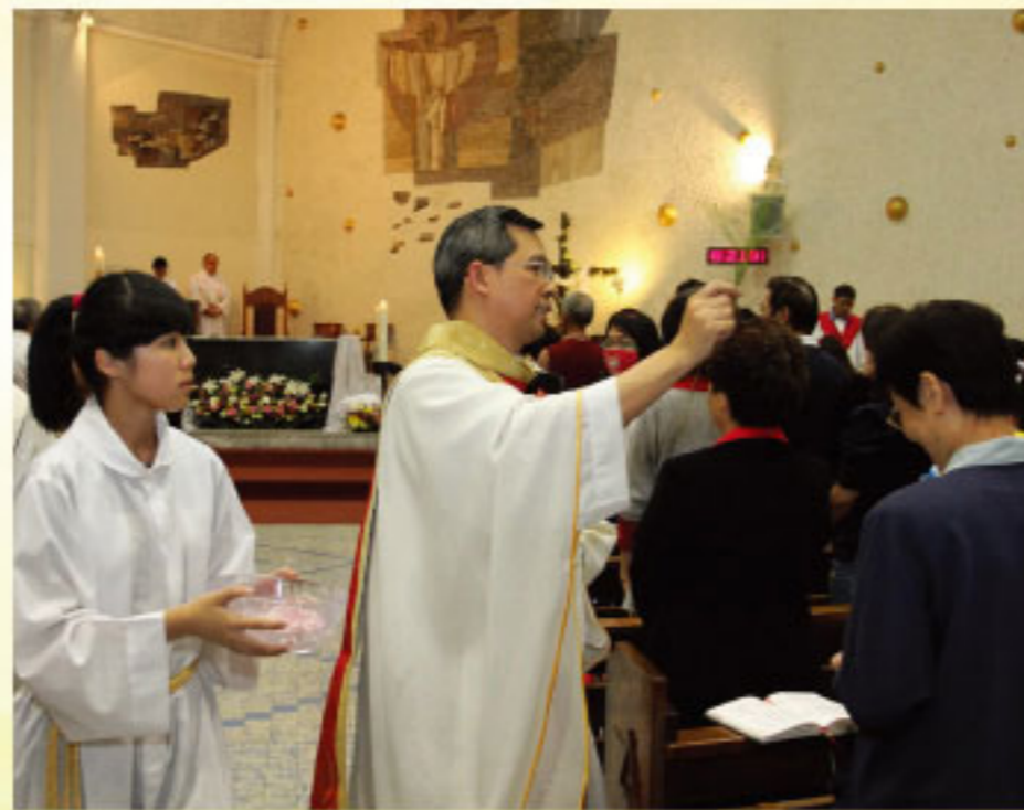
生命之水，賜福春雨