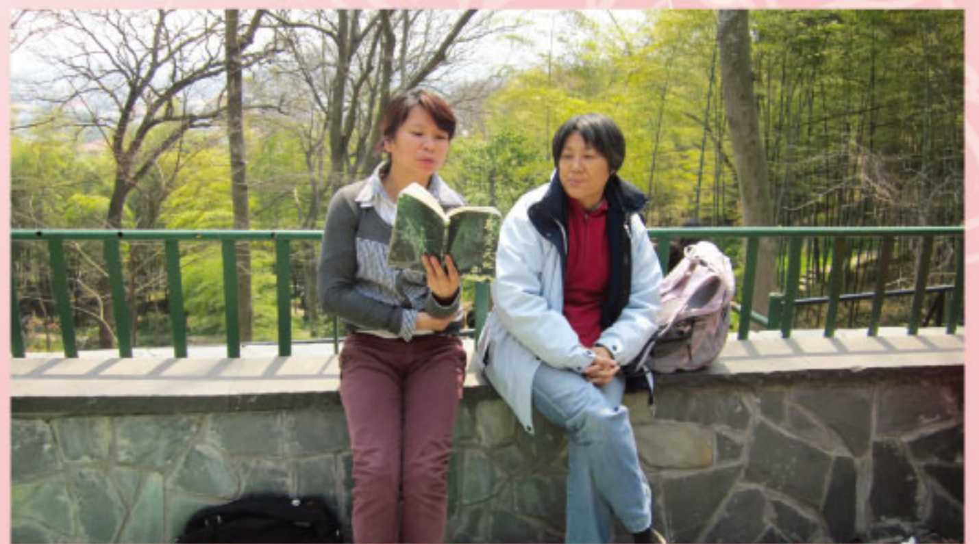
■ 與來自溫州的姊妹同唱聖歌讚美主