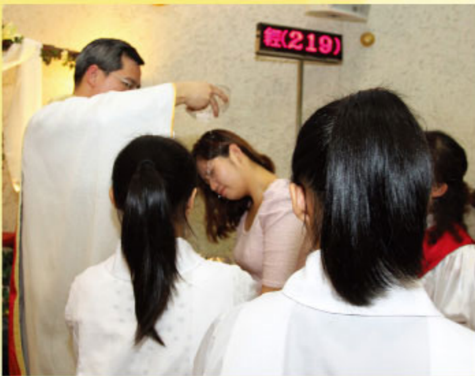
聖洗，接受主愛的印記