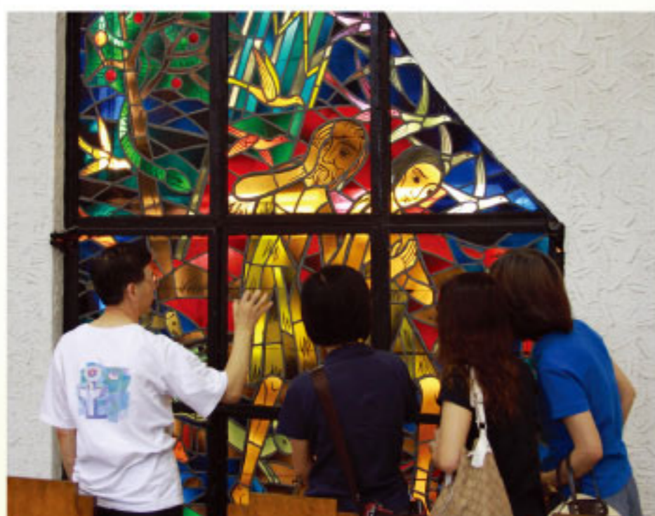
彩繪玻璃描述聖經故事