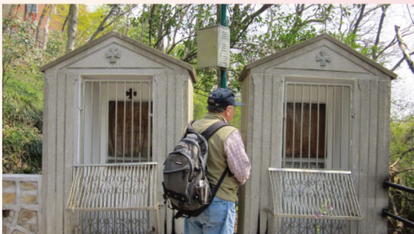
■ 作者端詳佘山聖母大殿前半山上的苦路亭

我們在心靈溝通契合中，不覺已過了好久時辰，在依依不捨中互道珍重，祈望在不久的將來會再相逢團聚。此次「認親與朝聖」行程歷時半個月，身、心、靈及福傳的收獲頗豐，感謝上主！讚美上主！