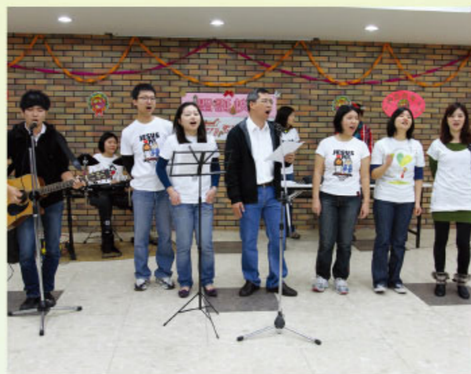
聖誕聯歡會首見聖三樂團