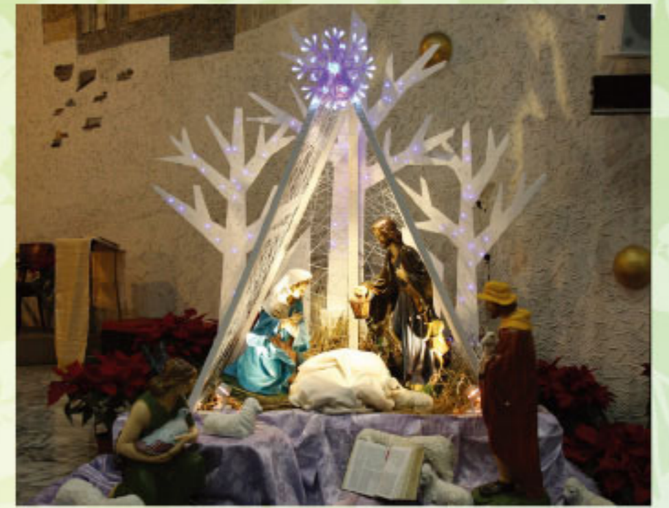
聖堂內特殊設計的馬槽