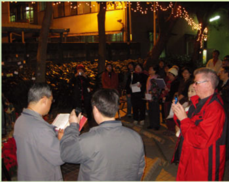
聖三堂首度舉行馬槽點燈禮