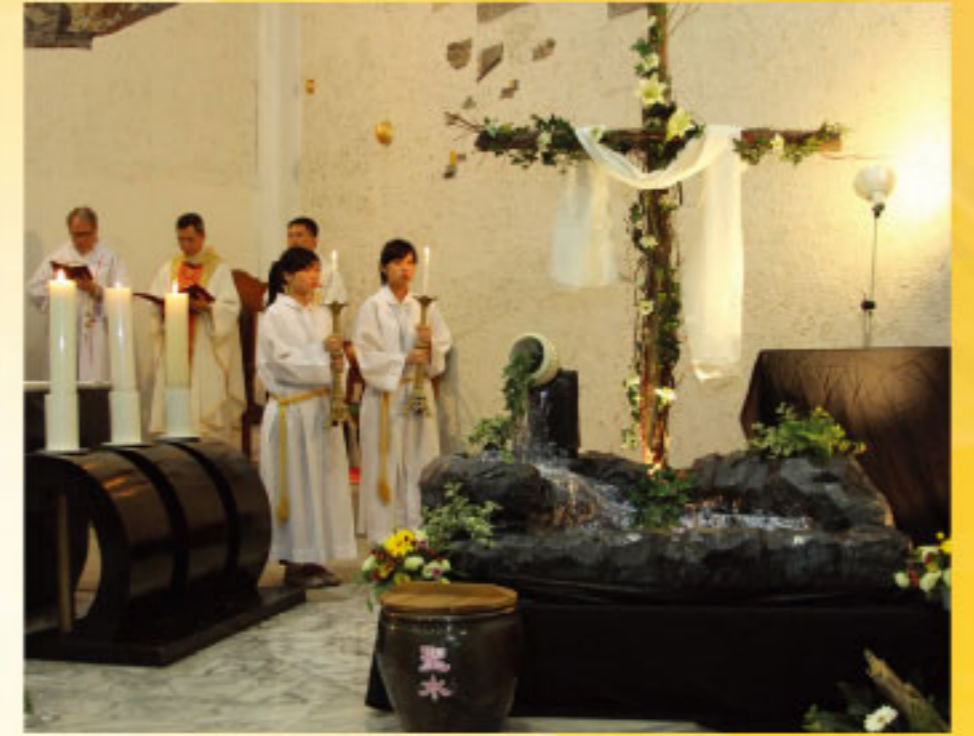
凡喝這水，永不再渴